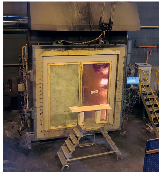
SSC Solid säkerhet under brandprovning.

och entrépartier med glas motsvarande denna klass. Dessa produkter är ej typgodkända.