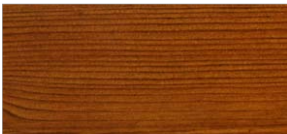
5 Lasyr L5