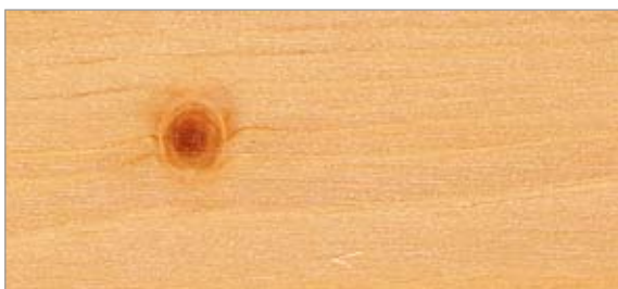
7 Lasyr L9