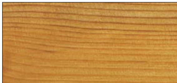
6 Lasyr L8