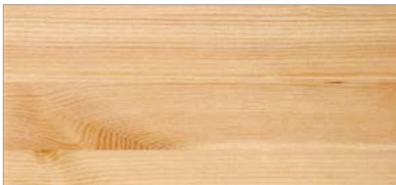
1 Genomsynlig lack