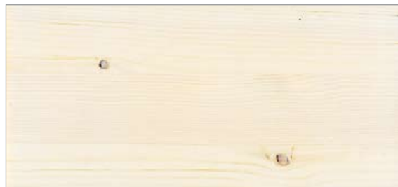
2 Lacklasyr 20 vit