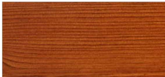
4 Lasyr L4