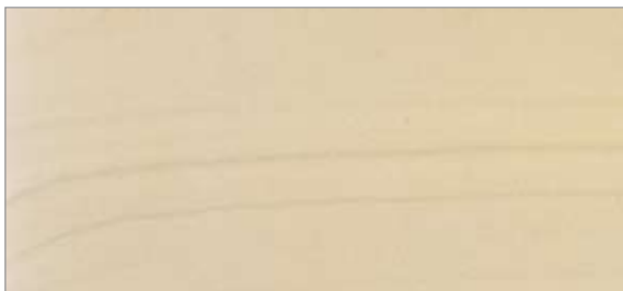
3 Lacklasyr 15 grå