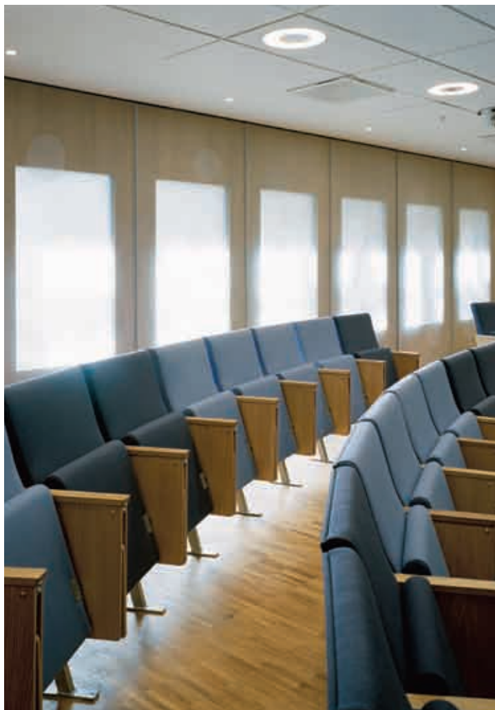
Blockväggen Dorma Variflex EM i bakgrunden med infällda glas ger här ett vackert ljus under stolarna.