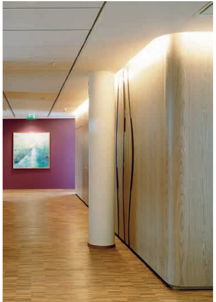
Ekpaneler med utskurna mönster för färgat glas för tankarna till nerv- och muskeltrådar.

Väggpaneler i projektet kommer i brandklassat utförande (brandklass Euroclass B-s1,d0) som varken brinner eller avger rök, från Gustafs Inredningar i Dalarna. Det handlar dels om paneler med integrerade elluckor vid pentryn, trapphus och hissar på varje plan – dels om panelerna med konstverk i färgat glas. Panelerna är i ek och har ett vitt pigment i lacken, som föreskrivits av arkitekten. Dessutom har man levererat ett antal specialgjorda dörrar som utmärker sig genom att de integrerats i panelväggarna, till och med gångjärnen är helt osynliga.