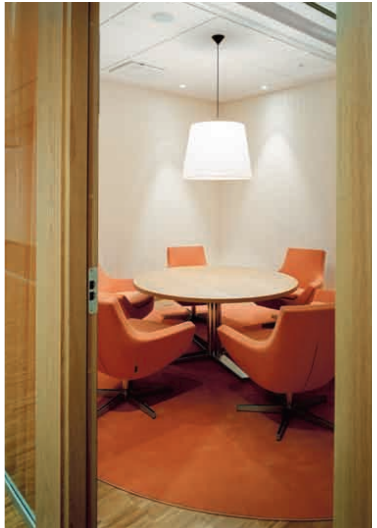
Fåtöljen Happy är ett bra exempel på svensktillverkade möbler med god design, hög komfort och slitstyrka.

Låt oss avslutningsvis lyfta fram ytterligare en möbel – fåtöljen Happy från Swedese. Detta är en genomtänkt, bekväm och slitstark sittmöbel i design av Roger Persson. Hos Pfizer finner vi drygt 80 Happy-fåtöljer i olika allmänna utrymmen.